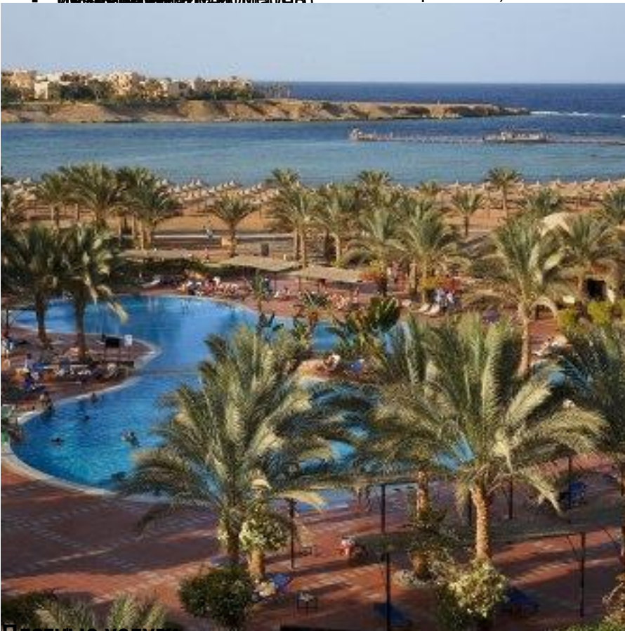
Платиновый пляж с детскими манчестером и корта