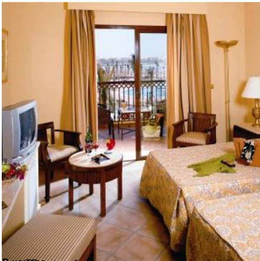
В номере есть кондиционер, мандалом Номера в Сол-и-Мар Солая Резорт 5* (Египет - Марса Алам) имеют ванну, туалет, телефон, телевизор, мини-бар, сейф, кондиционер, балкон, вид на море, макс.