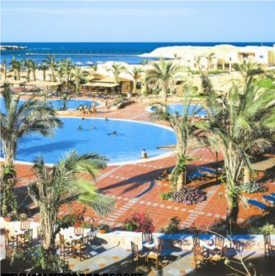
Сол и Мар Солая Резорт, аэропорт г. Марса Алам, 67 км от г. Эль Кусейр, в бухте Эль-Наср, в 10 км от первой береговой линии. 3077,