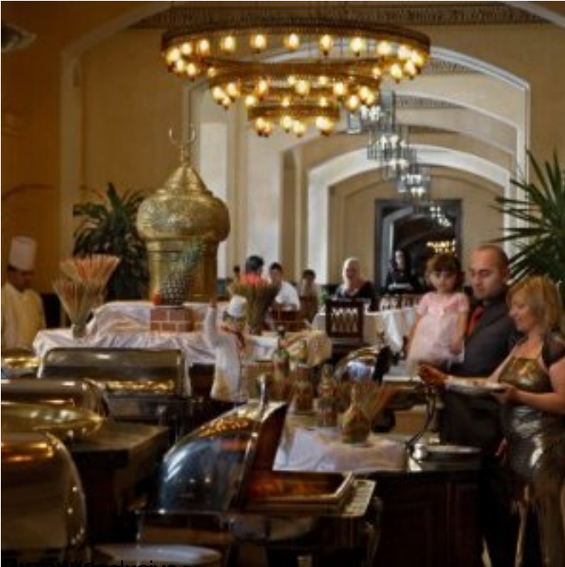
Интерьер ресторана (пол в зале с жестким покрытием)